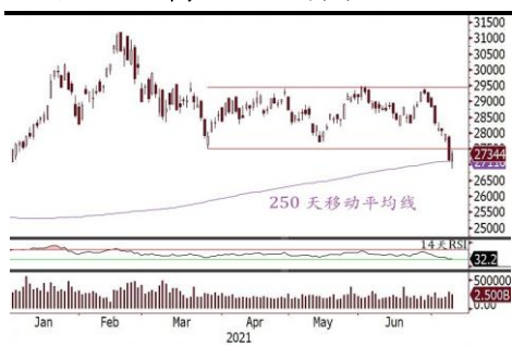
恒指超卖反弹，望重返横行区