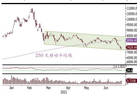
恒生科技指数于下降通道底部获支持