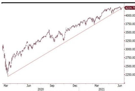
标普 500 指数重回升轨之上