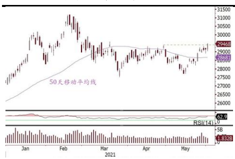
恒生指数升穿4月份高位

■ 图表分析：恒指挑战30,000，科指上试8,500。 恒指自从上周二升穿重要阻力50天移动平均线后，持续造好，昨天收市升穿4月份高位29,405，而14天相对强弱指数(RSI)尚未超买，估计恒指于6月份可反复挑战30,000点大关。恒生科技指数则自3月中起形成下降通道，近期反弹力度较强，有望挑战通道顶部约8,500。